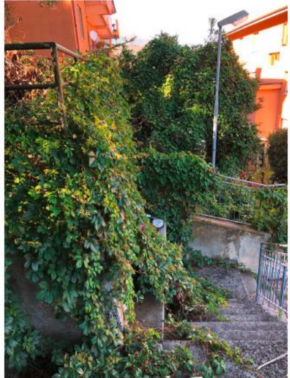
Vista del muro di contenimento dei terreni di proprietà comunale