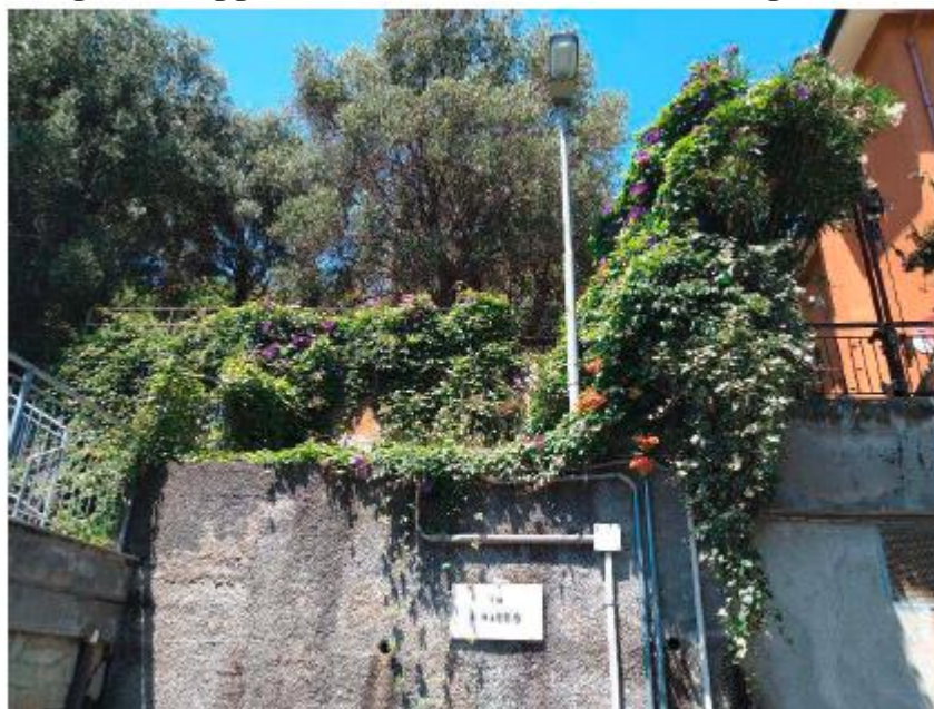
Vista dell'area di interesse dalla viabilità pubblica

Oggetto della presente valutazione, come già specificato precedentemente, è una parte di circa mq 12,00 del fg. 19 mapp. 712 identificata come da fotografie: