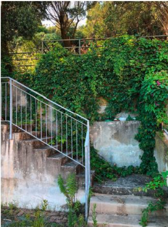
Vista della scala pubblica di accesso ai terreni comunali