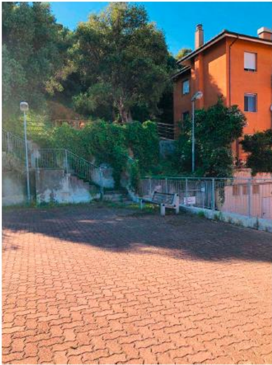
Vista generale del piazzale comunale e dell'area di interesse